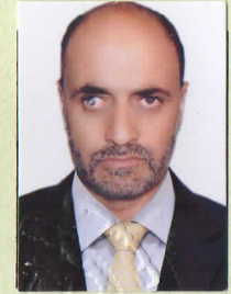
رئیس / President سید تیمور شاه